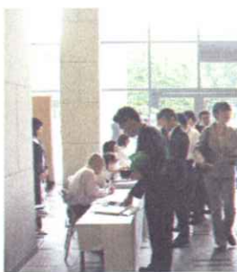
↑ 参加者で溢れる受付

去る六月十六(金)〜十八日(日)の三日間「第五十五回全日本鍼灸学会学術大会・金沢大会」が開催されました。当日は天候にも恵まれ、参加受付人数も千人を越える大盛況となりました。今回は「鍼灸の真価に確証を求めて —現代医療における鍼灸の役割—」をテーマに全国各地より会員が一同に会し、学会発表やパネル展示等が各会場で行われました。