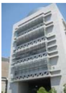
大阪国際会議場 にて開催