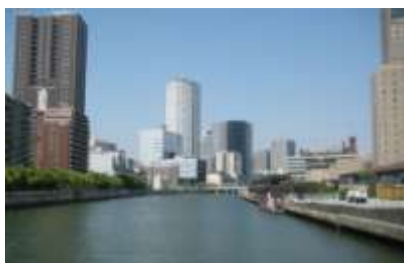
会場は水都大阪・中之島

Tel: 0749-74-0330 Fax: 0749-74-0466 E-mail: info@moxa.net URL: http://www.moxa.net