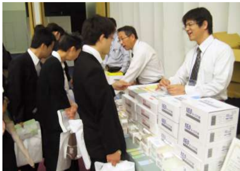
山正展示ブース 来場者の多さに 商品紹介にも 熱が入ります

六月十一日(金)と六月十三日(日)の3 日間にわたり、大阪国際会議場にて開催され ました、第五十九回全日本鍼灸学会学術大会 に出展いたしました。 三千四百三十三名という過去最高の参加者 で会場は大盛況。弊社が出展する商業展示会 場には絶えず参加者が集まり、山正ブースに もたくさんの先生方、学生の方がいらっしや いました。