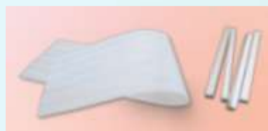
これまでゴミとなっていた ミラマット(左)とストレッチロール(右)

長生灸業務用1000壮シリーズ(レギュラー・ライト・ハード・微煙タイプ)の 梱包形態が、ミラマット巻きからスリーブ使用に変わりました。これにより軽 装化を実現し、石油製品であるミラマット、ストレッチロール等のゴミ減量化に つなげました。