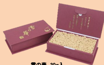
雪の華 30g入 (線香付き)

温灸用艾は極上温灸と並温灸の2種類あります。生姜灸やにんにく灸にご利用頂ける艾となっています。