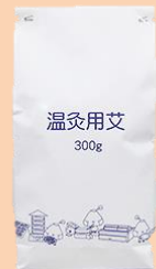
極上温灸 並温灸 各 300g入