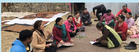
住民への事業についての説明会