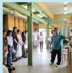
もぐさ製造工場の見学会