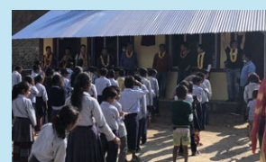
治療ボランティア活動・校舎建設事業の様子