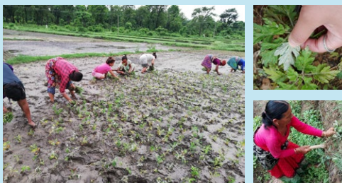
現地の女性達によるヨモギの栽培