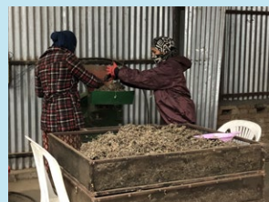
当社工場での女性雇用